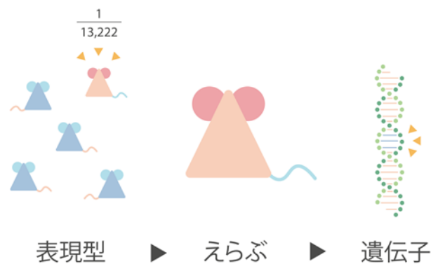
図 1 本研究では、ランダムな突然変異を生じさせたマウスのなかから注目する表現型を見つけ、その原因遺伝子を探索するフォワード・ジェネティクスを採用した。