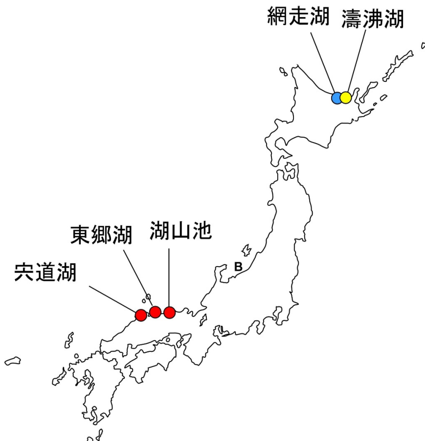
図4 日本の汽水湖における塩分耐性アオコの分布 色の違いは異なる遺伝子型（ミクロシスティスの個体の違い）を表す。