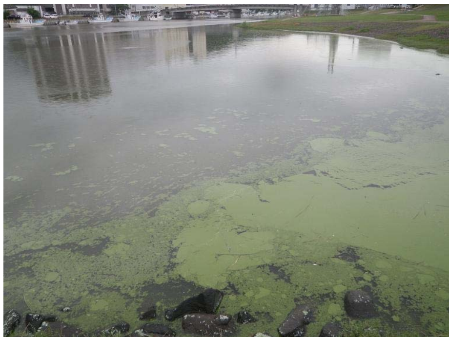
図2 汽水で出現したアオコ（網走湖から流出する網走川、2017年）