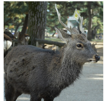
図1. 雄のニホンジカ。ミトコンドリアDNAを利用できる雌に比べ、雄の種内系統や移動、その歴史の変遷などについてデータを得ることは難しかった。